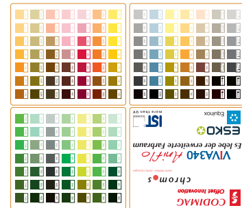
147 Pantonetöne gedruckt aus CMYKOG.

Die hervorragende Auflagenstabilität des Farbwerks ermöglicht, analog dem Digitaldruck, den Druck im 4C oder im erweiterten Farbraum. Dies eliminiert Farbwechsel und erhöht die Effizienz und Profitabilität der Druckmaschine.